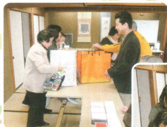
支援物資を送ろう