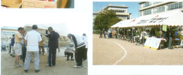
景品準備とテント設営 (社会体育大会) など