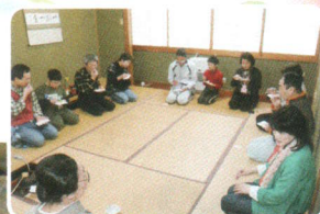
～チャリティー茶会より～