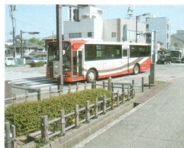
現在の芦中町交差点

昭和六年、都市計画道路として野町口から工事が開始され幅員十九・一呎、コンクリートの厚さが〇・四呎。広い道が突っ走るので人々はあきれ、驚いた。万一の場合は軍用飛行機の滑降にでも供するものと思っていたらしい。人々は幅広い道路の必要性に疑問を持つほどで、人っ子一人歩いていない広漠たる様相だった。野町六丁目、泉町、芦中町の殆どの家が道路用地として宅地を提供した。在来線は五・六呎だったから大幅な後退や転居で、曳き方という職人が家を後退させ、大工が大掛かりな改築にあたった。後退した家々は、改築を機にガラス・コンクリート・タイル・電灯などを用い、天井も高く明るい感覚になったが、反面、これまでのゆとりある宅地が五十五〜六十坪に区画整理され狭小化。垣根や