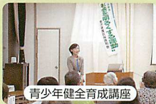
青少年健全育成講座