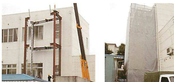
エレベーター工事の様子(7月上旬)

各種団体の会議も、講座も徒歩による上り下りを気にせずに、エレベーターを利用して3階ホールで開催できます。重量物などの運搬もエレベーターの利用で負担軽減です。これによって一層、3階の利用が進み、皆さんの使いやすい公民館になればと願っています。