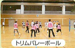
トリムバレーボール