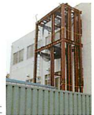
エレベーター工事着工