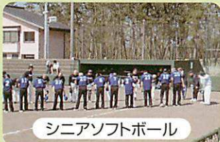
シニアソフトボール