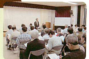
平成25年度公民館委員会