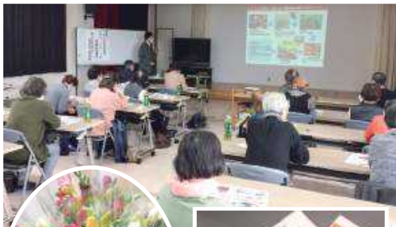
▲昨年度の富山薬膳研修の様子